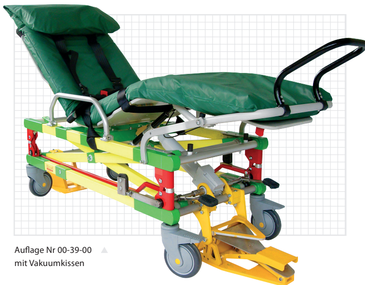
▲ Auflage Nr 00-39-00 mit Vakuumkissen